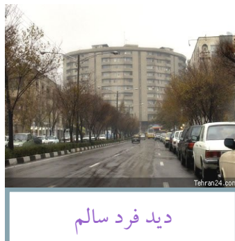
دید فرد سالم