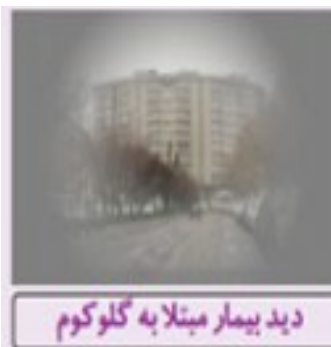
دید بیمار مبتلا به گلوکوم